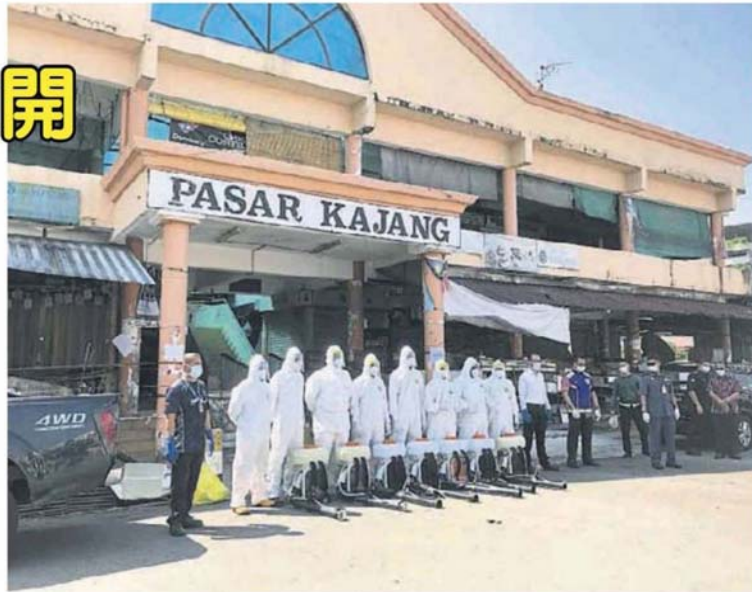
后到巴刹大消毒。 加影市议会与乌冷卫生局上周在巴刹传出新冠肺炎病例