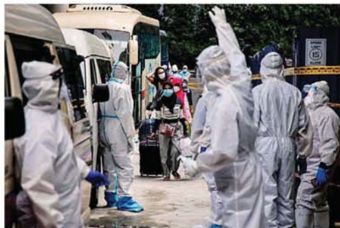
卫生部会隔离曾与确诊患者有密切接触的人士,只要14天没有症状就可以解除隔离,而确诊者就必须到院接受治疗。

他说,确诊者已被送到沙登农业博览会接受治疗和隔离,而当局将从这个事件中吸取经验,避免其他扣留营和拥挤的宿舍,也成为冠病或其他疾病的传播中心。