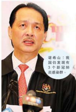
大马各州累计新冠肺炎数量 截至中午 12 时