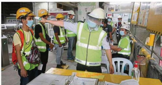
Safety first: Foreign construction workers complying with social distancing rules at the Tun Razak Exchange project site in Kuala Lumpur.

Meanwhile, state health, welfare, women empowerment and family committee chairman Dr Siti Mariah Mahmud said RM2.06mil has been allocated by the Selangor government for screening of high risk groups.