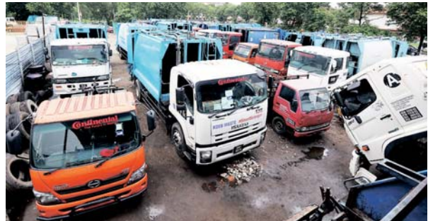
Afbatni Resources kini memiliki 30 buah lori sampah yang digunakan untuk mengangkut sisa pepejal di sekitar Lembah Klang.