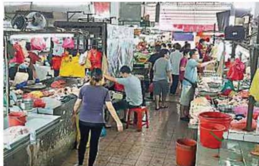
巴剎有80%档販开档做生意，人流比较之前略少，主要是巴剎在开斋节首3天休业，民众在超市购入足够食材。

据了解，该巴剎今天有80%档販经营生意，受到开斋节首3天休业关系，很多民众在超市购入足够食材，因此前来巴剎采购民众比较前略少。