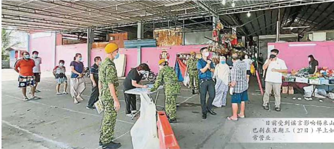
日前受到謠言影響錫米山巴剎在星期三（27日）早上如常營業。

Provided for client's internal research purposes only. May not be further copied, distributed, sold or published in any form without the prior consent of the copyright owner.