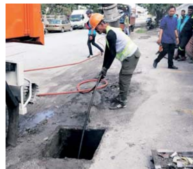
Seorang pekerja Afbatni Resources menjalankan kerja-kerja pembersihan di kawasan pengurusan syarikat berkenaan di Lembah Klang.

Ujarnya, pada tahun 2008, beliau akhirnya mendapat projek di Pandamaran, Klang. Kawasan tersebut berkeluasan lapan kilometer persegi yang padat dengan pusat perniagaan,